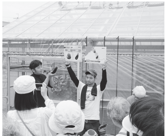
北野農園では海側と山側の水なすの違いなどを説明した

ツアー後、参加者からは「めったにできない貴重な体験ができた。農家の思い入れを聞き、大阪の農家を応援したい」と改めて思った」との声が寄せられるなど好評だった。