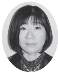
農業ジャーナリスト

これまで3人の講師の方を招き話を聞いた。焦点のひとつは「2022年問題」と、昨年創設された「特定生産緑地法」の