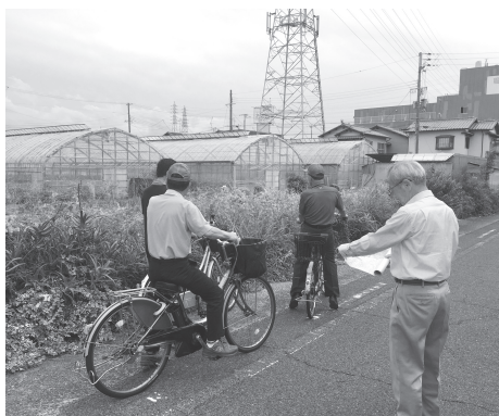
当日は自転車で巡回し、利用状況を確認した

どに伴い同様の傾向にある。都市農業・農地をめぐる環境が大きく変化する中で、全国農業新聞を活用して、農政をわかりやすく解説するなど、農業委員会法第6条第3項第2号に規