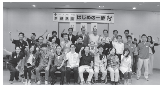
研修生と地元協力農家らによる記念撮影

6月16日、富田林市内で新規就農「はじめての一步」村の開村式が開かれ、20人の研修生が