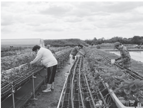
受講生はそれぞれ河南町、千早赤阪村のほ場で実地研修を受ける

続いて、3グループに分かれて意見交換した。従業員の育成にあたっては、ある程度任せないと成長せず、あまりトップが細かい作業に口を出しすぎても駄目だという意見が出る一方で、細かい部分も指示