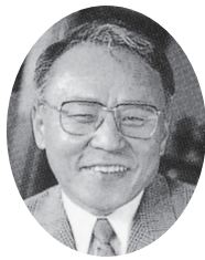
長屋王家木簡広報人 野菜文化史研究センター代表

昭和63年8月末に、奈良市役所の西側で奈良文化財研究所の発掘調査により「長屋王邸跡」と特定された場所から、後に「長屋王家木簡」と称される古代記録3万5000点が発掘されて今年で30年になります。