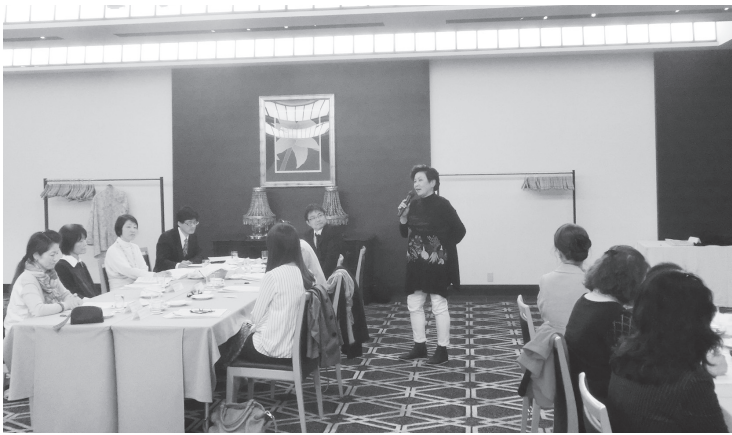
グループ毎に議論の内容を発表

これに対し平成29年12月末時点で全国の女性農業委員割合は11・8%、大阪では9・2%であり、さらなる登用促進が必要