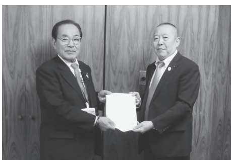
石川高石市副市長(右)に要望する杉本代表理事組合長

平岸和田市長へ、26日に阪口伸六高石市長へ、それぞれ要望書を提出した。内容は、生産緑地面積要件を