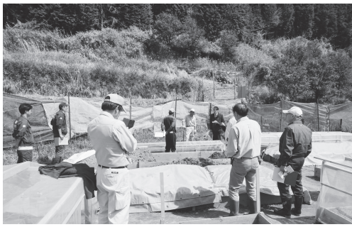
土づくりや水の確保等について新規参入者から事情を聞いた

向のある農地をHPでも公開中で、これを見た借受希望者と利用権設定の調整を進める例も。