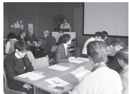
三島地区農振団体協視察研修の様子

に「農を体験する」、「農を学び実践する」、「食を楽しむ」ことを実感できる兵庫県の施設として平成18年にオープン。