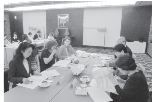
各テーブルで熱い議論が交わされた